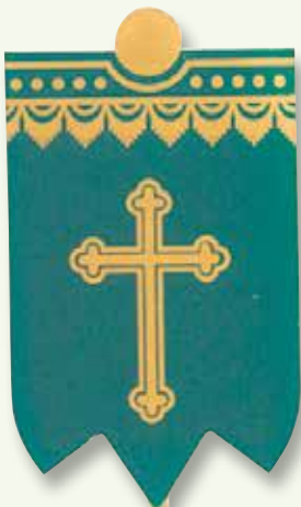
Seiden-Fähnchen mit Golddruck